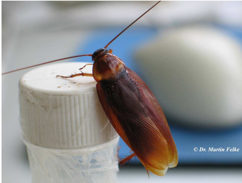
Abbildung 1: Amerikanische Schaben sind gut an der rotgelben Binde am Hinterrand des Halsschildes zu erkennen

Die hellbraun bis rotbraun gefärbte Amerikanische Schabe ( Periplanete americana ) wird mit 35 bis 40 mm Körperlänge deutlich größer als die Deutsche oder die Orientalische Schabe. Die extrem langen Antennen können länger als der Körper werden. Ganz typisch ist eine rotgelbe Binde am Hinterrand des Halsschildes. Der Körper der Tiere ist auffallend flach. Die langen und kräftigen Beine besitzen viele, abstehende Borsten.